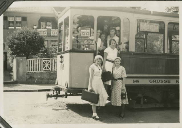
Haltestelle Nr 5 Grüselthal