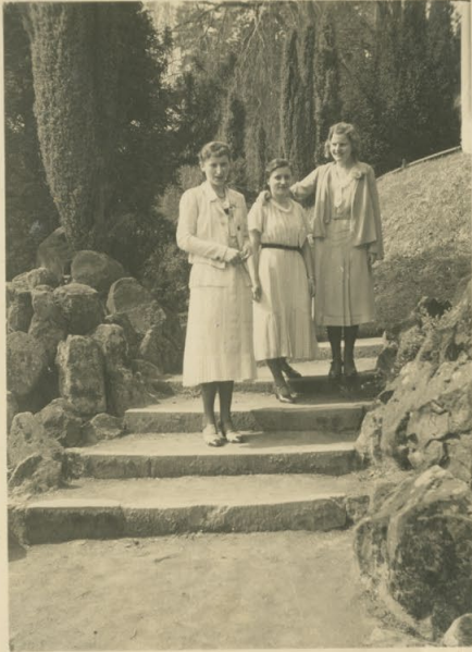
Im Schlosspark am 1. Mai 1932