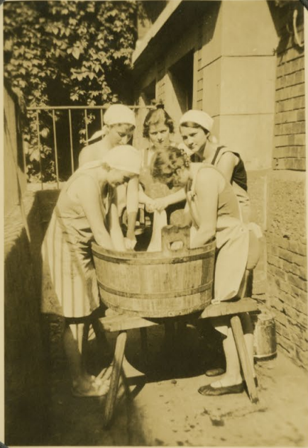
Heim- chen bei der Arbeit