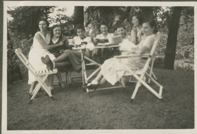
Lustige Gesellschaft im Garten am 22. Mai 1932