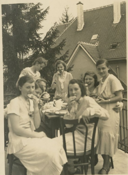
Sonntagsnachmittags Kaffee auf dem Schutzzimmer Balkon