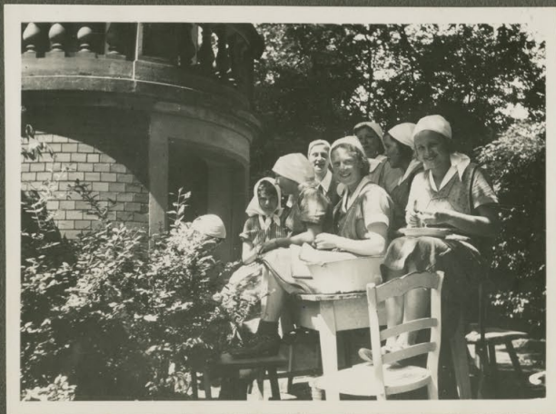
beim Stachelberru pflücken.