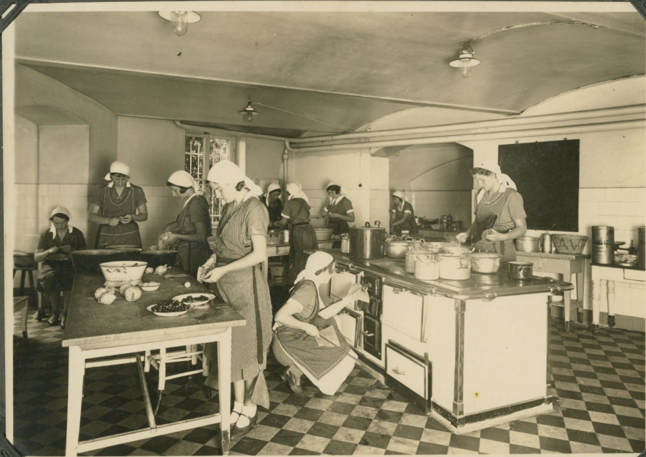
Gruppe I. beim Kochen im Juli 1932.