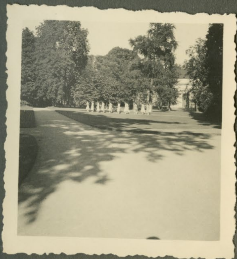
Spaziergang durch den Schloßpark Panorama- weg.