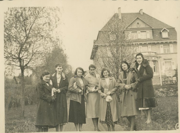
Vor dem „Fernblick“