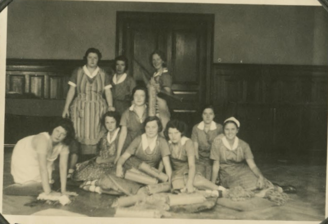
Beim Späßen des Speisesaales vor dem Frauen.