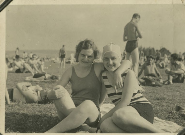
Heimkehr am Strandbad in Kassel August 32