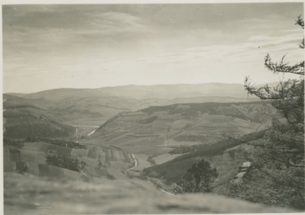
Blick von B. H.