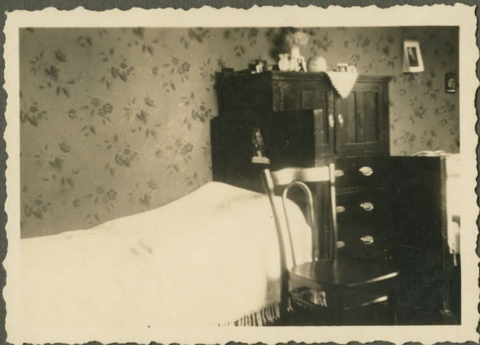
Meine Ecke im Mathildenzimmer