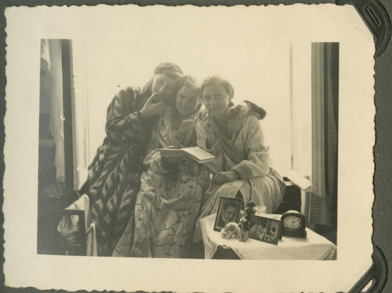
Leckerer Schmaus in der Ruhestunde