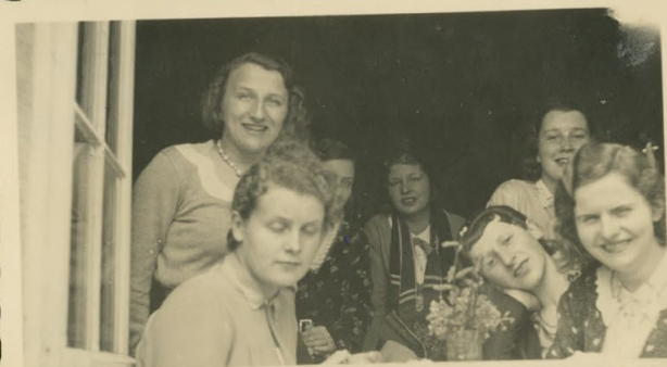
Himmelfahrt im „Café Fernblick“